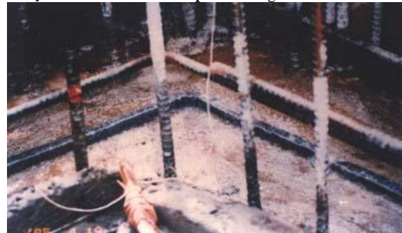
L p t Bentonite Waterstop NT cho m ch n g n g

L u ý : Bentonite Waterstop NT không t đ i n h ch t vào b m t .